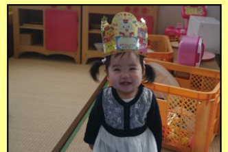
カードがいっぱいになったよ