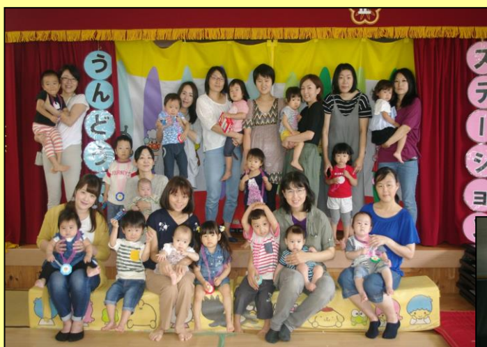
玉入れ、パン食い 楽しかったね！