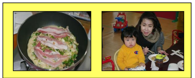
パパデー パンケーキ作り