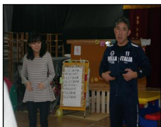
鬼のお面かわいいね！